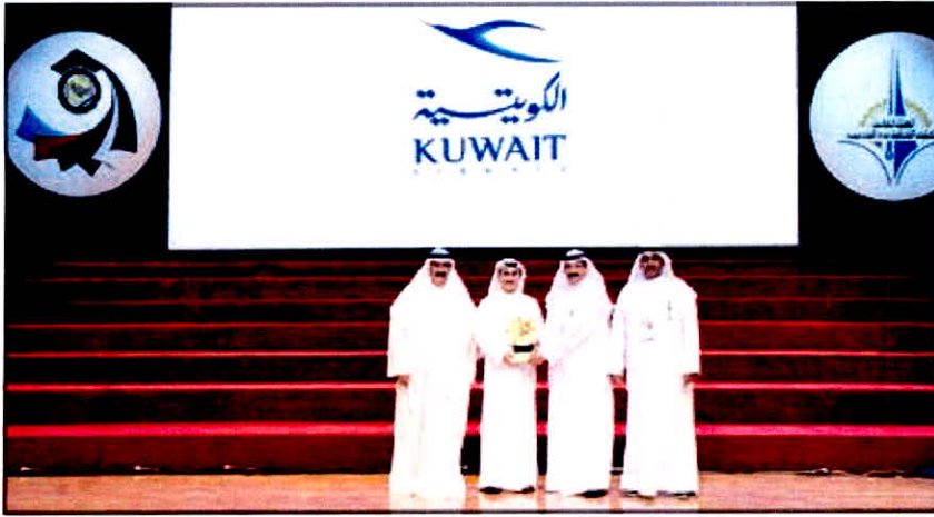
علي المصنف مكرما الخطوط الجوية الكويتية في حفل الختام

في إطار سعيها لتطبيق برنامجها للمسؤولية الاجتماعية ودعم الإبداع والشباب والرياضة والتعليم، رعت شركة الخطوط الجوية الكويتية الدورة الرياضية الثامنة للجامعات ومؤسسات التعليم العالي بدول مجلس التعاون الخليجي بصفتها الناقل الرسمي للدورة، والتي استضافتها الهيئة العامة للتعليم التطبيقي والتدريب خلال الفترة من 1 إلى 10 الجاري، وذلك بمشاركة حوالي 730 رياضيا وإداريا يمثلون 16 مؤسسة تعليمية خليجية، كما تضمنت الدورة إقامة منافسات في ألعاب كرة القدم وكرة الطاولة والتنس وكرة الطاولة واختراق الضاحية إضافة إلى كرة القدم الصالات.