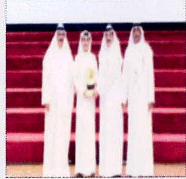
المضيف بكرم الخطوط الجوية الكويتية

رعت شركة الخطوط الجوية الكويتية الدورة الرياضية الثامنة للجامعات ومؤسسات التعليم العالي بدول مجلس التعاون الخليجي بصفتها الناقل الرسمي للدورة، والتي استضافتها الهيئة العامة للتعليم التطبيقي والتدريب خلال الفترة من 1 - 10 الحالي وذلك بمشاركة حوالي 730 رياضيا وإداريا يمثلون 16 مؤسسة تعليمية خليجية، كما تضمنت الدورة إقامة منافسات في ألعاب كرة القدم وكرة الطائرة وألعاب القوى والسباحة والتنس وكرة الطاولة وأخيراً الضاحية إضافة إلى كرة القدم الصالات. وقال مدير دائرة العلاقات العامة